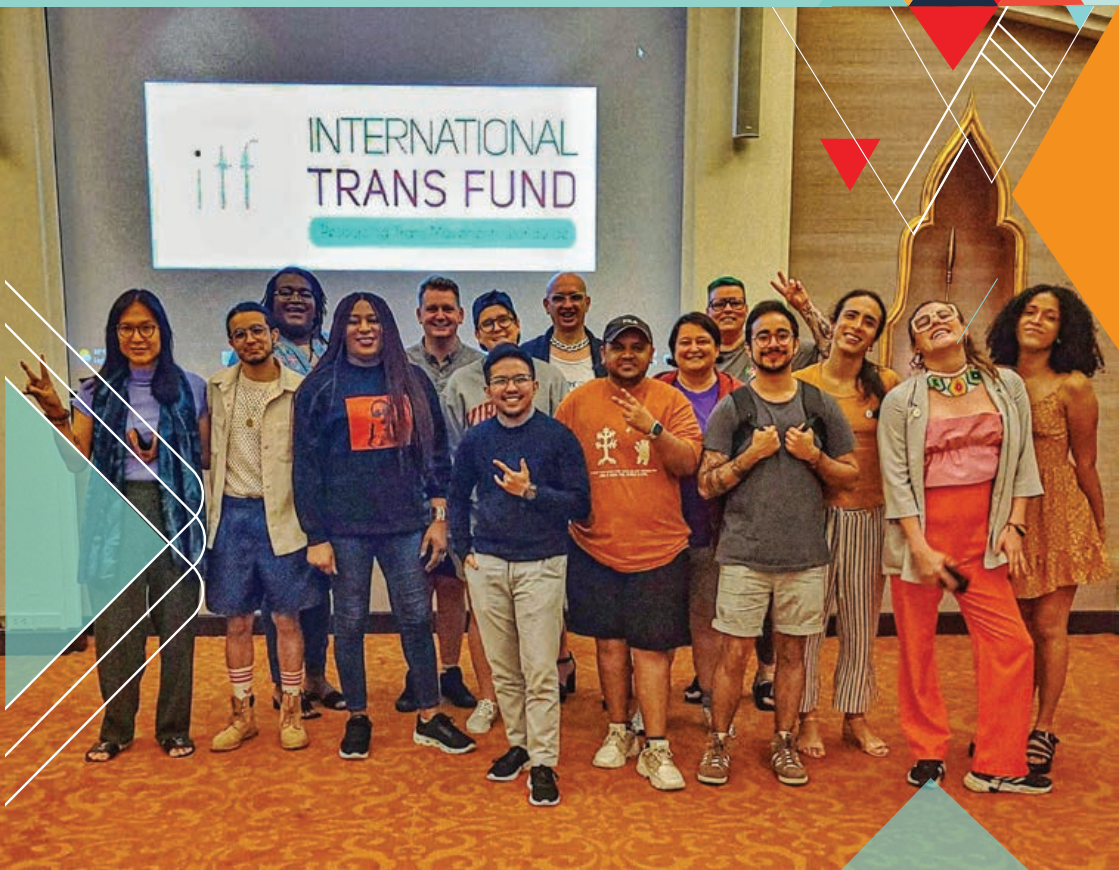
GMP In-person Meeting (June 2023)