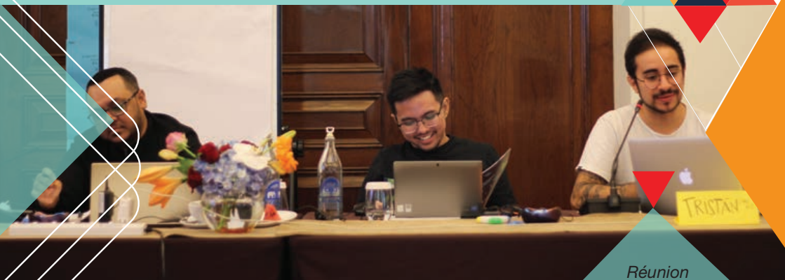
Réunion du Panel d'octrois de subvention