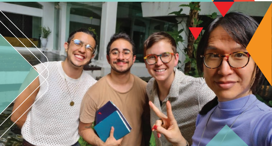
Réunion du Panel d'octrois de subvention

L'ITF soutiendra les organisations qui fournissent des services directs, par exemple des conseils médicaux ou juridiques ou des services sans rendez-vous. Cependant, les services directs ne peuvent pas être les seules activités dans lesquelles votre organisation s'engage. Votre organisation doit également s'engager dans des activités de renforcement du mouvement comme décrit ci-dessus.