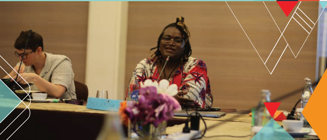
Réunion du Panel d'octrois de subvention