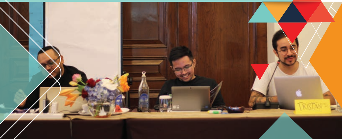
GMP In-person Meeting (June 2023)

问题10： 询问您在此赠款期间计划开展的主要活动。需要包括贵机构所有的活动，而不是仅仅提供那些由ITF赠款支持的活动。这将有助于我们的赠款讨论组了解您的常规性工作以及您打算做什么。