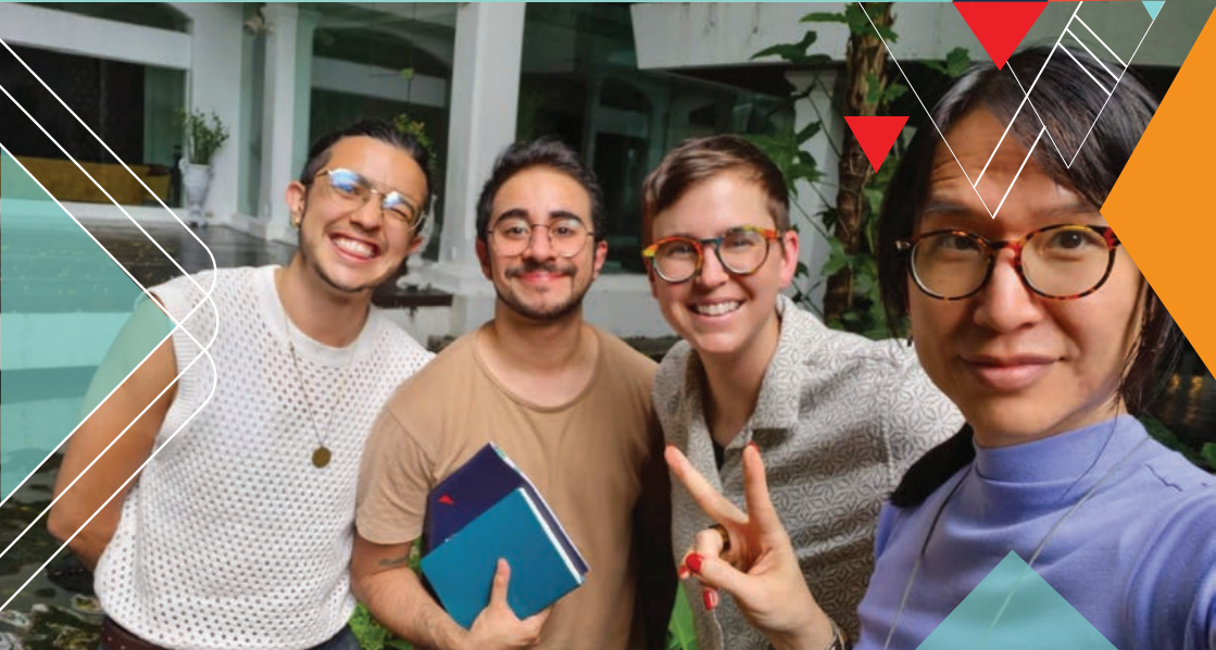
GMP In-person Meeting (June 2023)