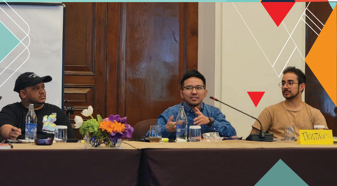
GMP In-person Meeting (June 2023)