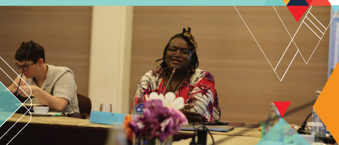
GMP In-person Meeting (June 2023)