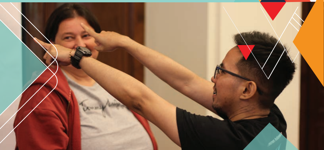
GMP In-person Meeting (June 2023)

董事会成员或资助评审小组成员及其所涉及的组织可以在董事会成员或资助评审小组成员辞职后立即申请ITF资助。