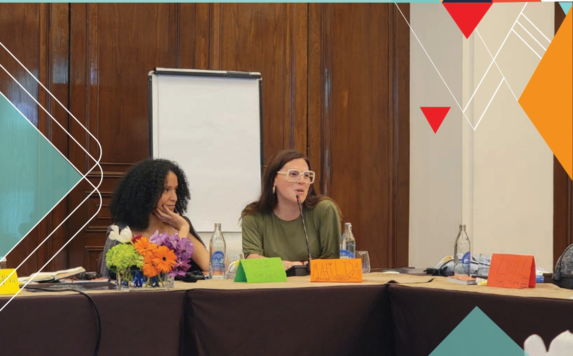
GMP In-person Meeting (June 2023)

ITF不再通过我们的电子邮件地址接受申请。为了考虑获得资助的可能性，您必须通过资助门户申请。如果您遇到困难， info@transfund.org