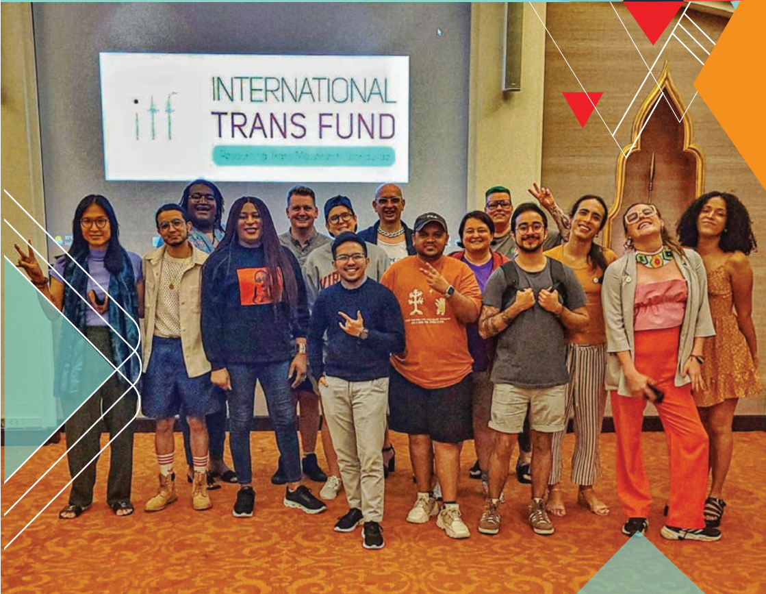
GMP In-person Meeting (June 2023)